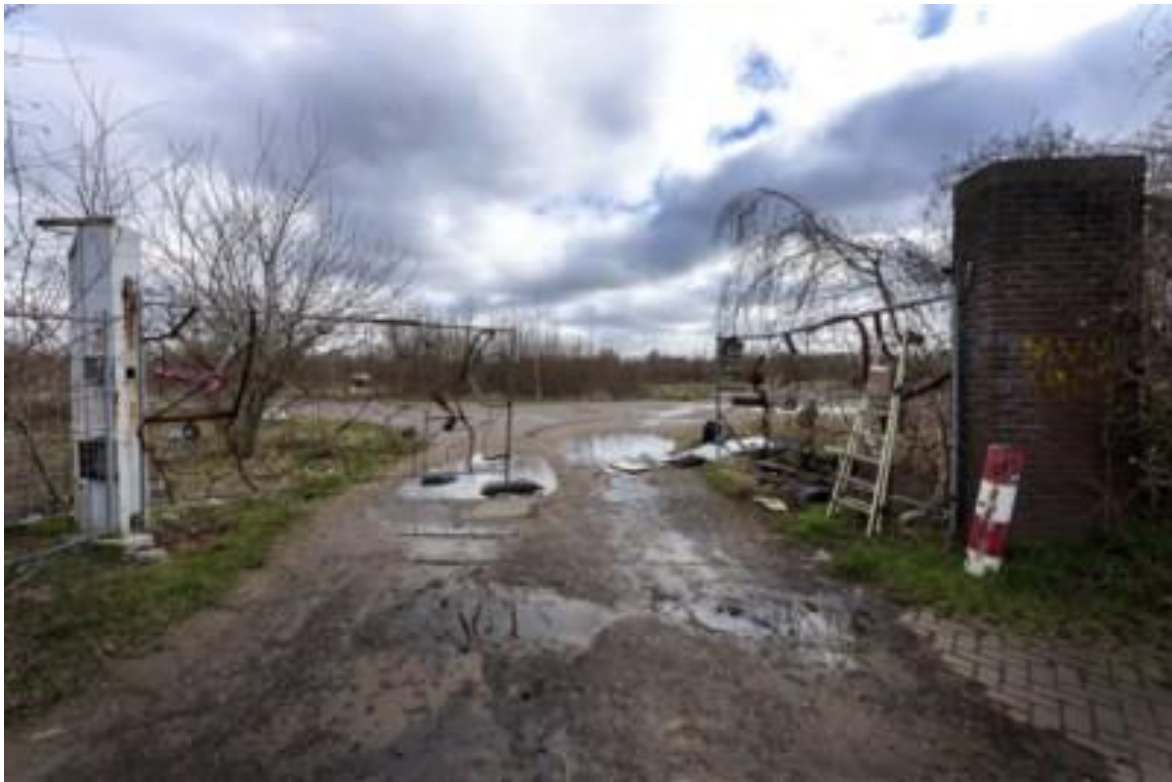
Het nu nog braakliggende Tregaterrein bij Limmel.

7 november 2020 om 15:45 door Joos Philippens